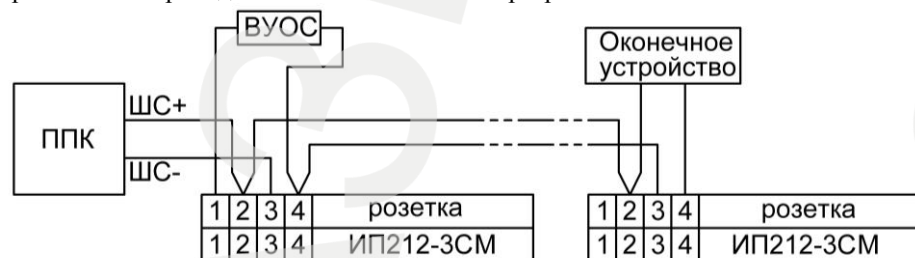
Рисунок 1 – Схема включения

На рис.1 показана типовая схема включения в двухпроводный шлейф пожарной сигнализации при фиксации сигнала «ПОЖАР» по одному извещателю. Схема и номиналы оконечного устройства, определяют производители ППК. Схема включения с фиксацией сигнала «ПОЖАР» по двум извещателям, а также расчет сопротивлений приведены на сайте компании-разработчика.