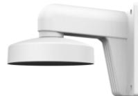
DS-1273ZJ-135 Настенный кронштейн