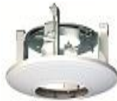
DS-1227ZJ Внутрипотолочное крепление