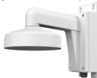
DS-1273ZJ-135B Настенный кронштейн с монтажной коробкой