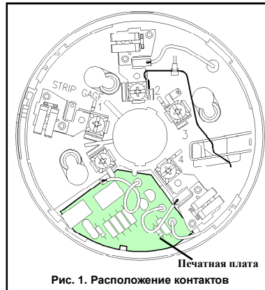
Рис. 1. Расположение контактов

В дальнейшем Вы можете отказаться от использования функции защиты от несанкционированного извлечения, отломив и удалив пластмассовый рычаг полностью. Однако после этой процедуры функция защиты от несанкционированного извлечения уже не будет подлежать восстановлению.