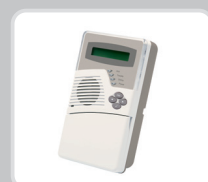
Клавиатура; голос; статус