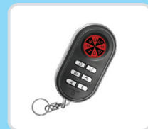
Брелок; индикация статуса