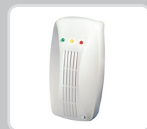
Детектор газа метан