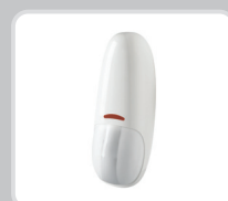
ПИК детектор "шторка"