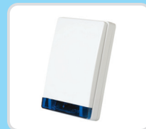
Радиоканальная внешняя сирена и строб-вспышка