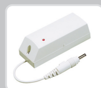
Детектор протечки воды