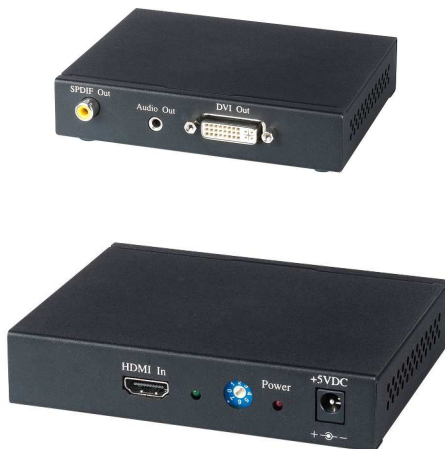
Рис.1 Внешний вид HD01