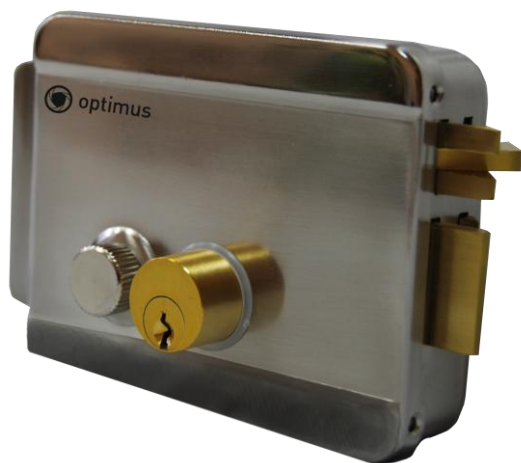
Optimus EMR-02 (хром)