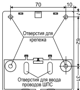
Рис.1 Расположение отверстий для крепежа, распределительные размеры

Подключите к клеммам, расположенным на плате извещателя, оконечный (если извещатель последний в ШПС) и дополнительный (при необходимости) резисторы и провода ШПС. Установите крышку на основании извещателя. Закройте, и при необходимости опломбируйте защитное стекло.