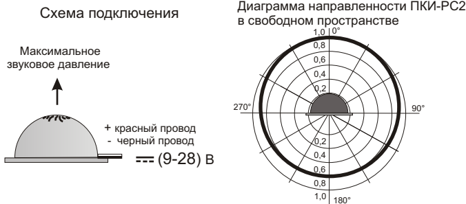
Рис.2 Схема подключения и диаграмма направленности Оповещателя ПКИ-РС2.

5.2. На рис.2 показана схема подключения и диаграмма направленности звука оповещателя ПКИ-РС2.