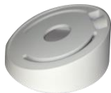
DS-1259ZJ Потолочное крепление