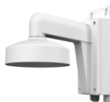
DS-1272ZJ-110B Настенный кронштейн