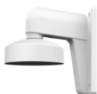
DS-1272ZJ-110 Настенный кронштейн