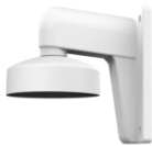
DS-1273ZJ-130-TRL Настенный кронштейн