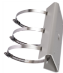
DS-1275ZJ Крепление на столб