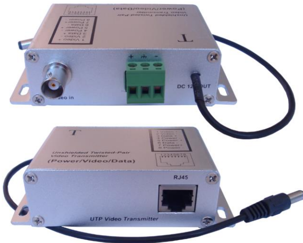
Рис.1 Внешний вид передатчик TA-CPD