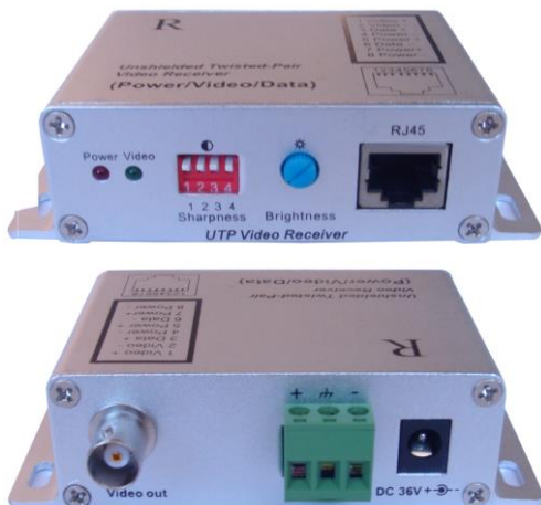
Рис.2 Внешний вид приемника RA-CPD