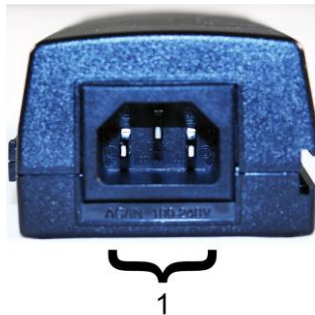
Рис. 2. Инжектор Midspan-1/190A, Midspan-1/300A Midspan-1/300G, вид сзади