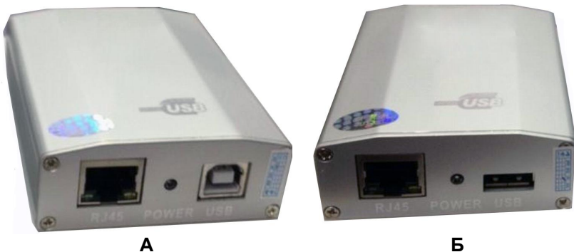
Рис.1 Внешний вид TA-U1/3 (A)+RA-U1/3(Б)