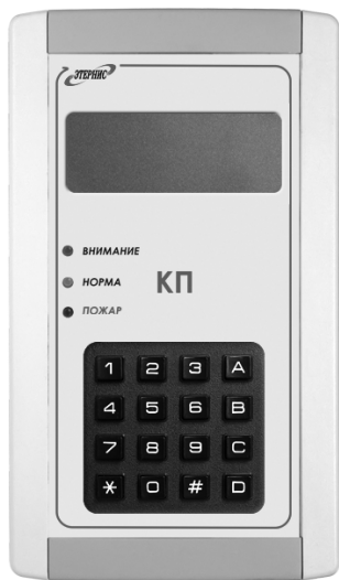
Рис. 1. Внешний вид «КП»

4.2. Внешний вид Изделия приведён на рис. 1, а внешний вид кронштейна крепления, с помощью которого изделие устанавливается на стене помещения – на рис. 2.